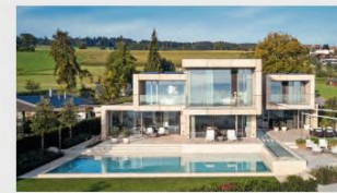
Platz 1: Zireg Ziwiler